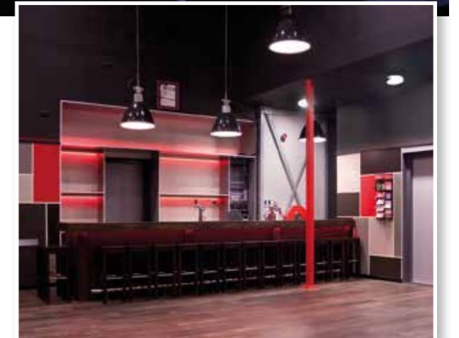
Pardoes heeft een hip en modern interieur en een gezellige bar.

www.jvargos.nl facebook.com/jvargosdeweere